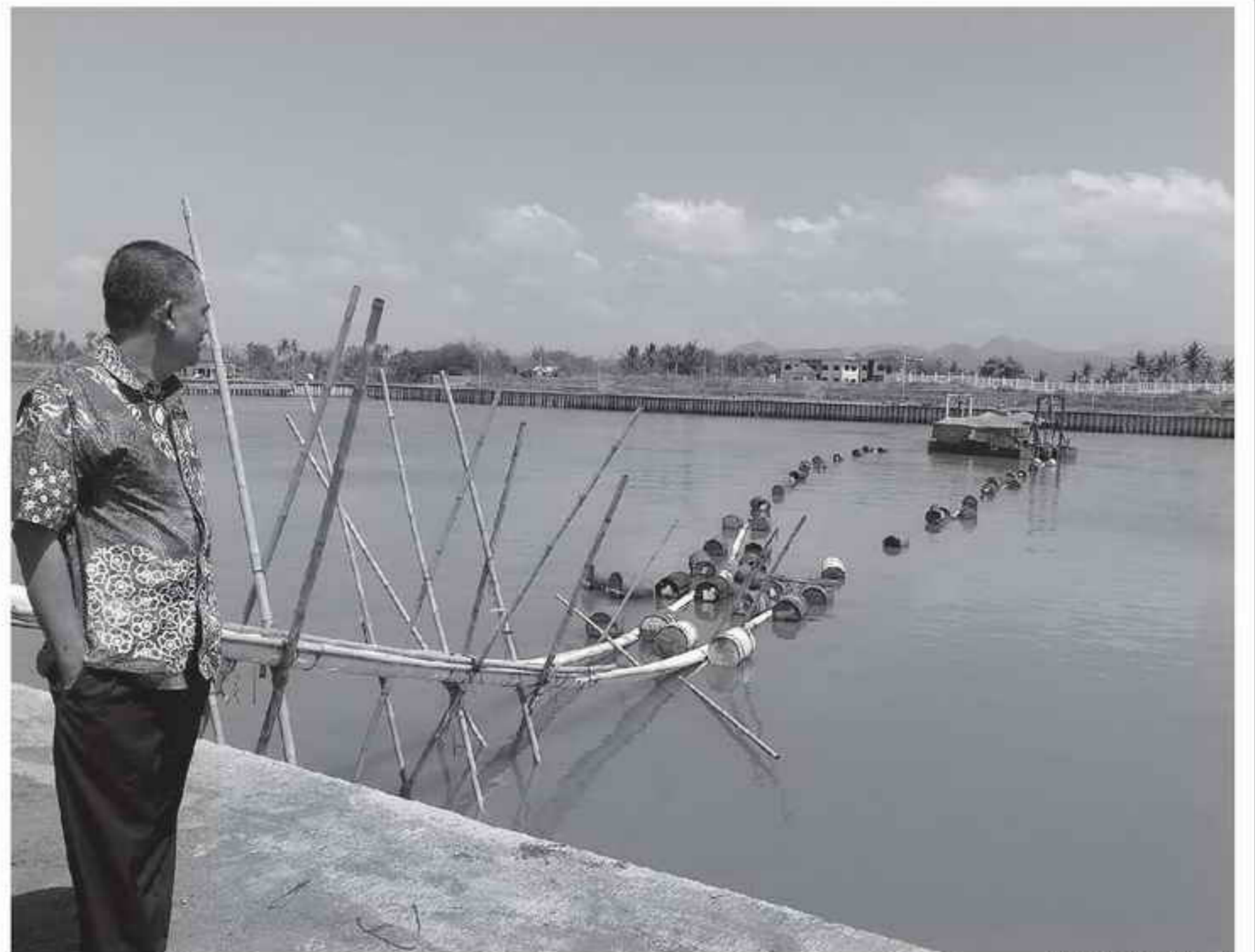
INSPEKSI - Anggota komis B DPRD DIY saat melakukan inspeksi di lokasi kolam Pelabuhan Tanjung Adikarto di Kulonprogo, Senin (16/11).